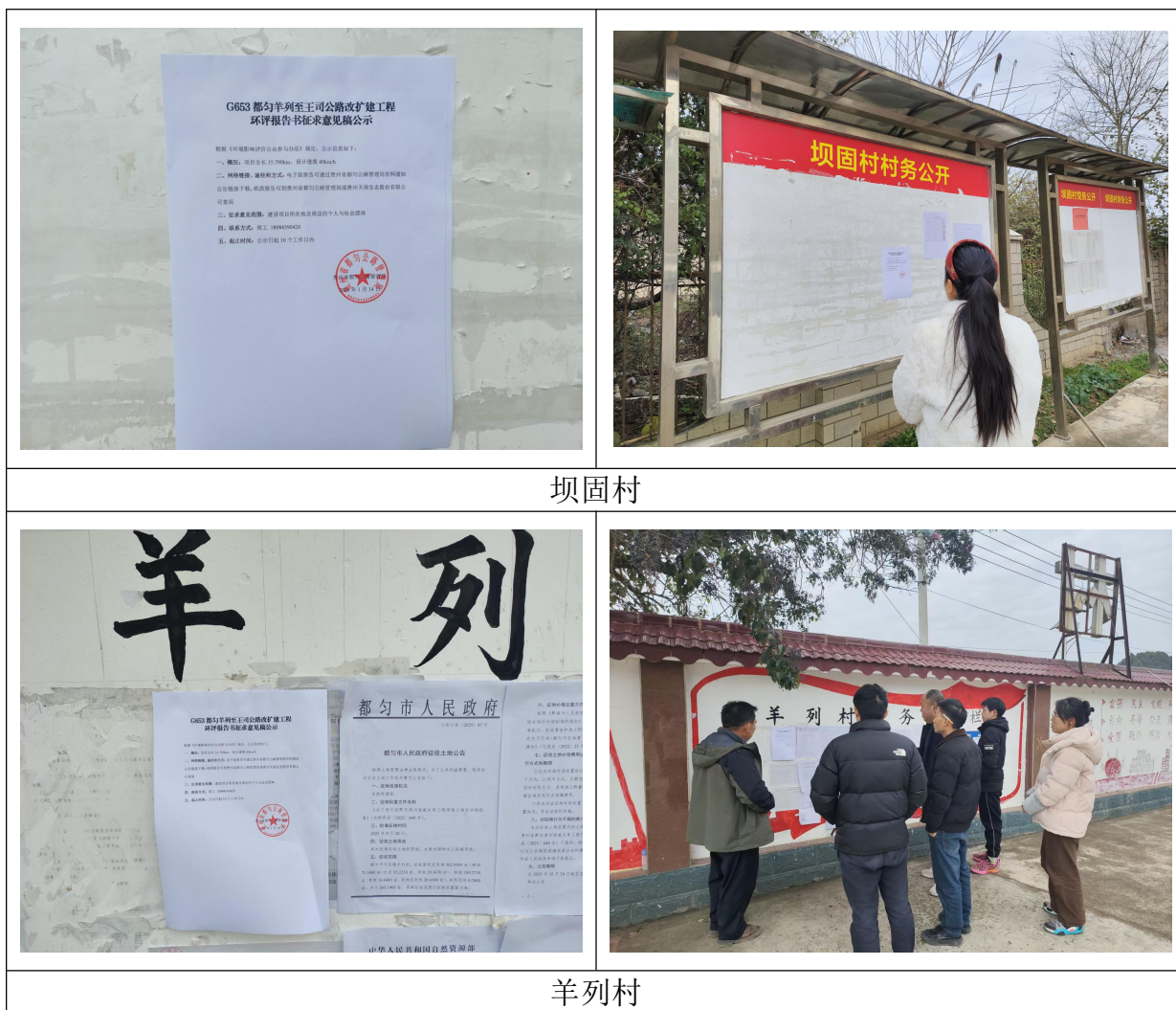
图 3.2-4 张贴公示图片