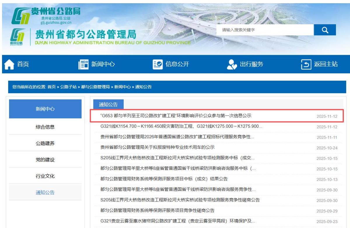
图 2.2-1 首次公示图片