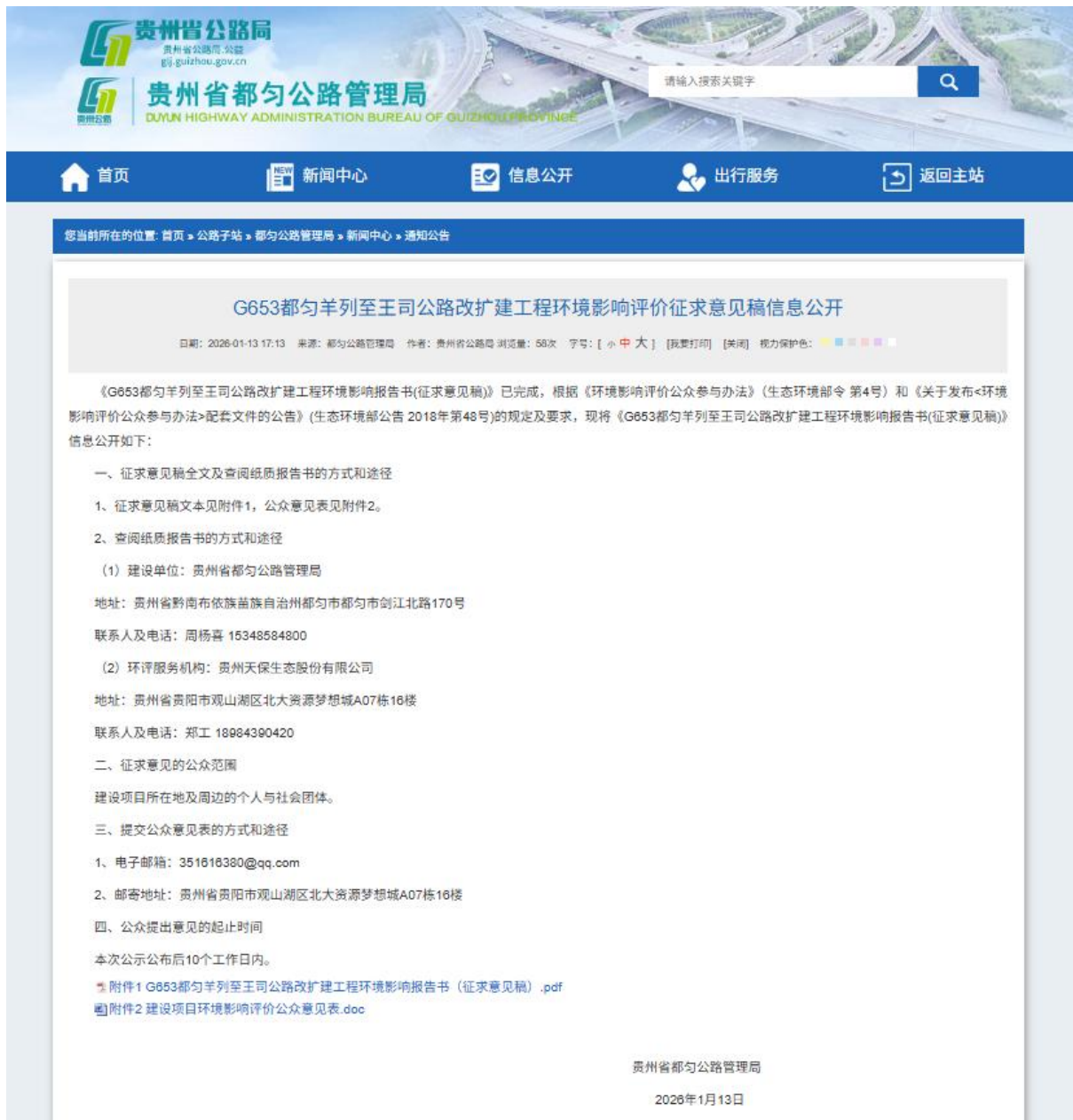
图 3.2-1 征求意见稿网络公示图片